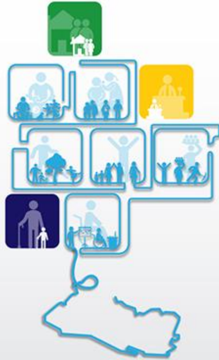
PLAN QUINQUENAL DE DESARROLLO 2014-2019

Política Social del Estado: salud, educación, empleo, pensiones no contributivas